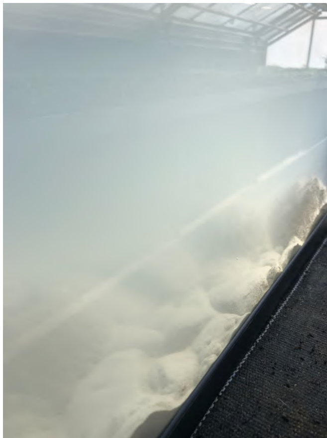
1 er avril 2023