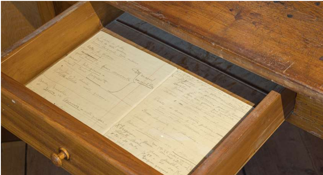
Marguerite évoque les immortelles ( Helicrysum bracteatum ) dans ses carnet de notes.