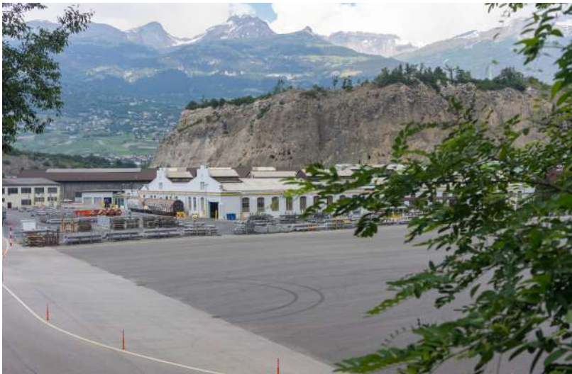
vue sur l'usine Constellium, depuis l'emplacement où gît lae dormeuse