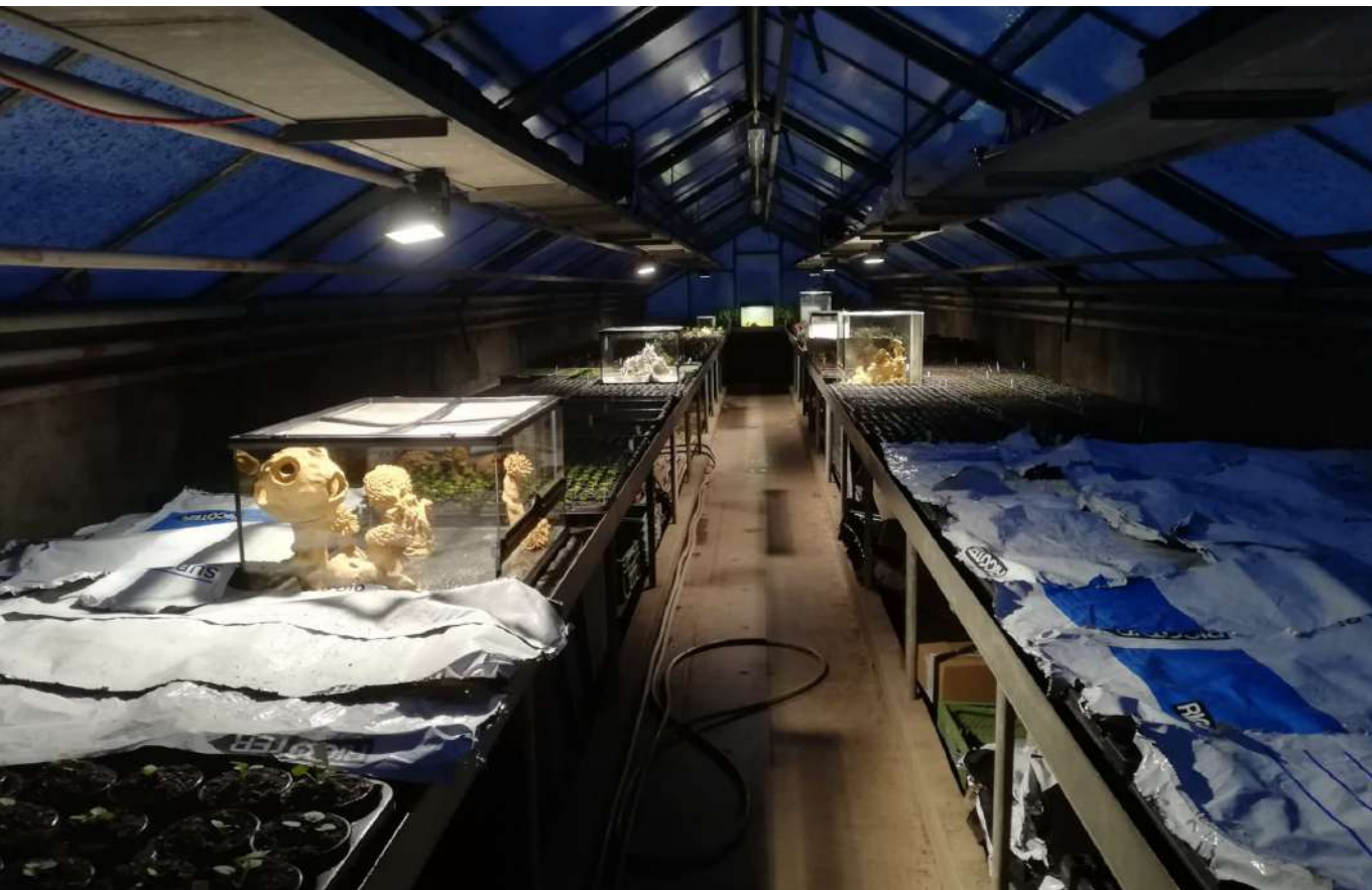
Vue de l'installation