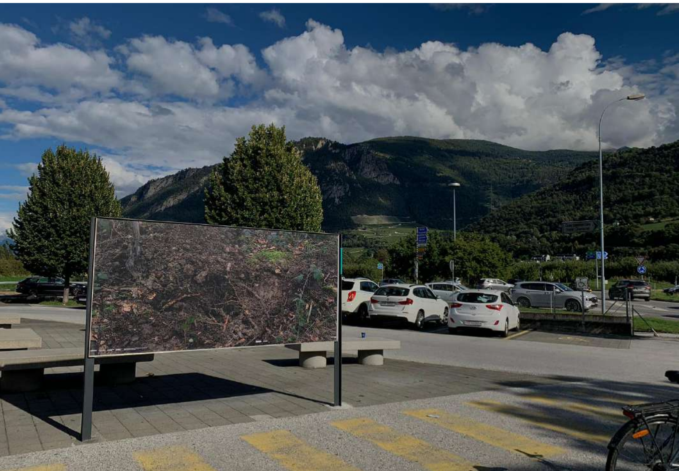
vue de l'affichage public, septembre 2023