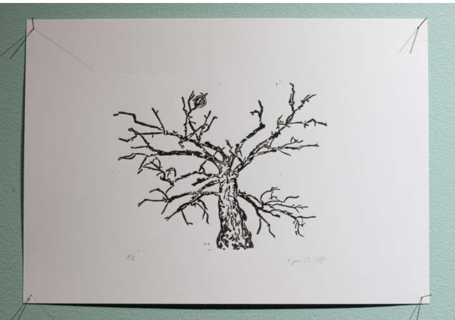
ce qui est mort ne sombre pas (Vercorin), 29.7×21 cm