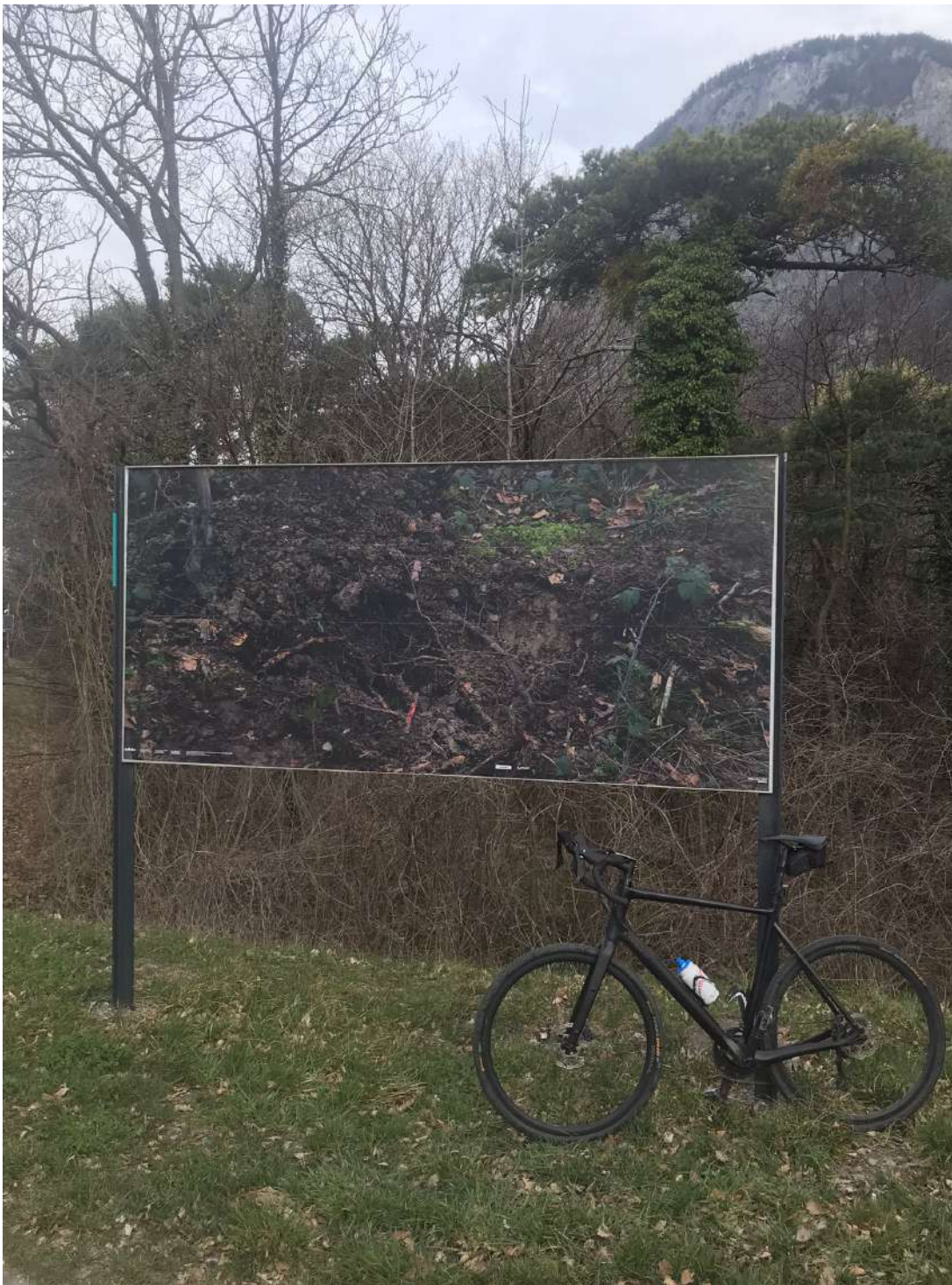
vue de l'affichage public, avril 2023