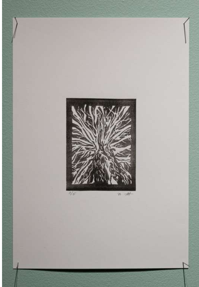
ce qui est mort ne sombre pas (Malévoz), 21×29.7 cm