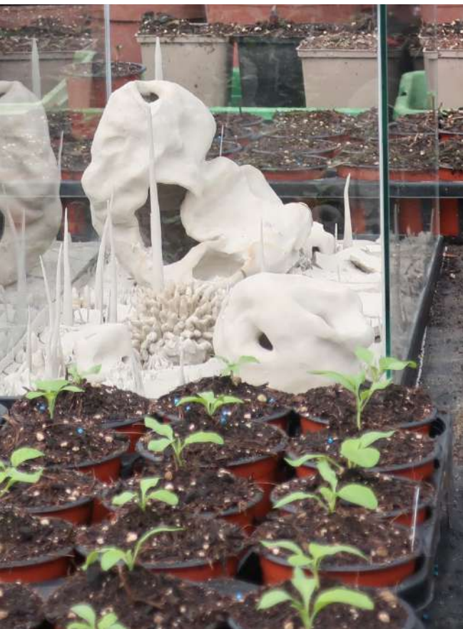
31 mars 2023